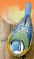
Sýkora modřinka v hnízdni budce

Sýkory modřinky si pořizují poměrně velké množství mláďat. V některých letech, kdy je hodně zdrojů potravy, kladou 9 až 15 vajíček. Pak ale bývá v ptačí budce docela těsno. Aby rodiče mohli tolik mláďat vychovat, musí nasbírat a pochytat 7 000 až 8 000 housenek a jiného druhu hmyzu.