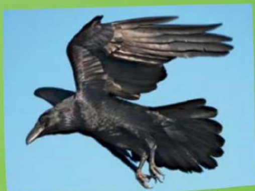
Krkavec v době toku

O krkavcích se traduje, že jsou chytří a hraví. To je možné pozorovat na jaře během toku. V té době páry předvádějí naprosto neobyčejnou leteckou akrobacii, kdy létají křídlo vedle křídla těsně vedle sebe, honí se, provádějí střemhlavý let, nebo dokonce krátkou dobu letí obráceni hřbetem dolů jako v lehu na zádech.